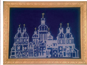
Рис. 3. Картини трикотажні

Таким чином, формування асортименту трикотажних виробів інтер'єрного призначення є перспективним напрямом з точки зору виготовлення екологічно безпечних текстильних матеріалів та виробів.