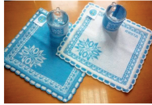
Рис. 2. Серветки трикотажні

Останнім часом все більшого розвитку набуває еко-стиль в оформленні інтер'єру дитячих кімнат. Йому притаманні прихильність до всього натурального, прояв турботи про навколишній світ та здоров'я дитини. Еко-стиль в інтер'єрному дизайні передає відчуття єдності з природою, приносить в дім природність і гармонію. Усі вироби та предмети декору, які знаходяться в дитячих кімнатах і оточують дітей, задля їх безпеки повинні виготовлятися виключно з натуральної сировини, такі як бавовна, льон, бамбук та ін.