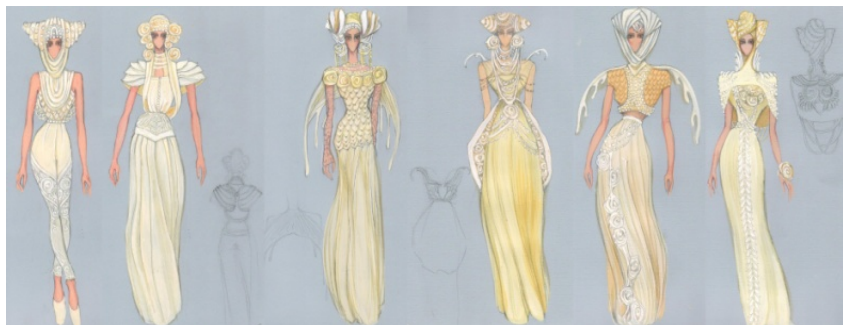
Рис.3. Пошукові ескізи

За допомогою ескізів студента викладачу, легше уявити образність проекту моделі в усіх його подробицях, формі, пропорції тощо (рис. 3).