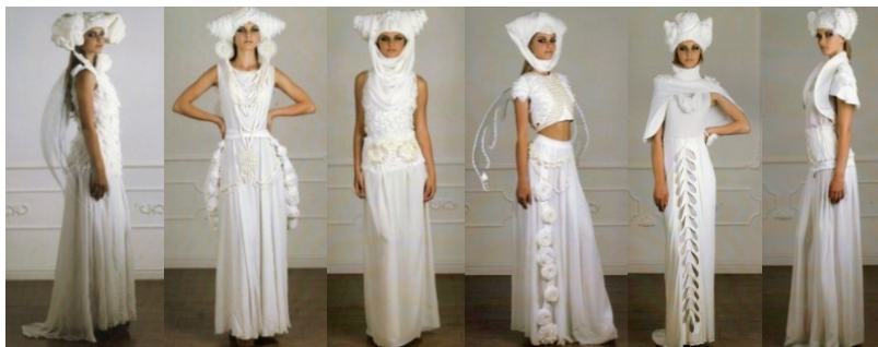
Рис. 5. Презентація колекції

5. Презентація колекції. Готові моделі колекції повинні відповідати пошуковим ескізам та задумці автора (рис 5).