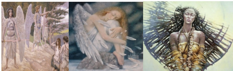
Рис 1. Аналоги

1. Збір аналогів. Творчими джерелами можуть бути: твори архітектури, машинні форми, інженерні споруди, предмети побуту, декоративно-прикладне мистецтво, біоніка, рослинні форми тощо. Дизайнера завжди цікавить форма взагалі, та сполучення і поєднання різноманітних побудов (рис. 1).