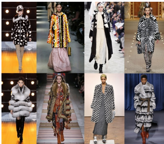
Рис. 1. Модели одежды из меха (интарсия и полосы) в коллекциях Thom Browe, Valentino, Braschi, Dolce Gabana, Burberry, Givenchy, Etro

Интарсия. В этом сезоне дизайнеры использовали технику интарсии в новом направлении. Раньше дизайнеры использовали литературные, сказочные мотивы: цветы и деревья, теперь актуальны, например, художественные отпечатки животных и абстрактные узоры, что повторяют естественную красивую окраску меха (Braschi, Valentino, Simonetta Ravizza, Yves Salomon).