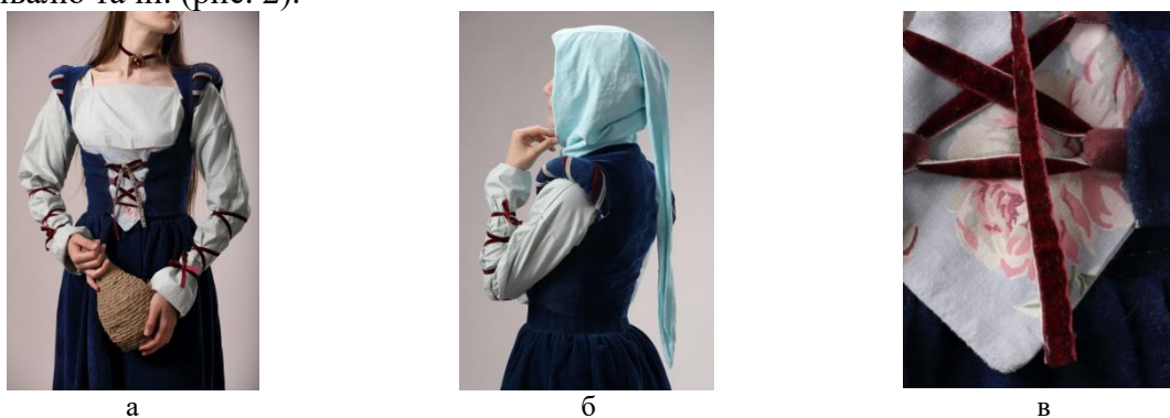
Рисунок 2 – Інтерпретація готичного костюму

Тож, конструкція нової броні сприяла появі нових форм європейського одягу. Разом з готичною архітектурою жіночий одяг отримав форму вертикальної спрямованості: подовжений вгору силует, відділена від ліфа спідниця. Верхня частина костюма - вузький ліф з вузькими довгими рукавами та геометричним вирізом на грудях. Висока талія зі шнурівкою, головні убори зі спадаючими кінцями витягнутої форми (атур, шаперон). Використовувалася оксамитова тканина, переважали насичені кольори і рослинні орнаменти. Чорний колір, популярний для сучасної готики, в ті часи був не актуальним. У ході дослідження, було проведено експеримент: адаптовано готичну модель костюму під сучасний метод виготовлення одягу шляхом власної інтерпретації вивчених візуальних джерел (манускрипти, gobelени, картини) для подальшого використання в сферах: театру, виставкового заходу, реконструкційного фестивалю та ін. (рис. 2).