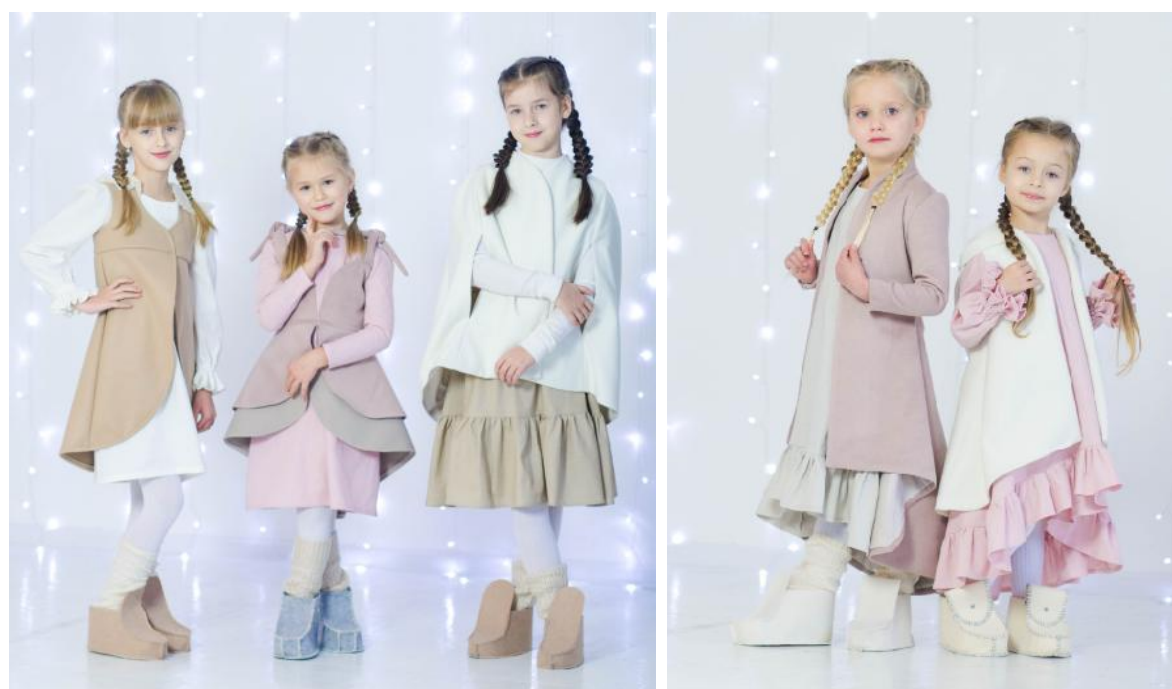
Рис. 3. Авторська колекція дитячого одягу у фешен-стилі «бохо» (автор О. С. Гриценко)