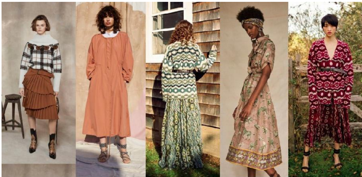
Рис. 2. Моделі одягу, виконані у фешен-стилі «бохо». Колекції сезону «Осінь–зима 2018/2019»: а) Alberta Ferretti 14 ; б) Apiece Apart 15 ; в) Altuzarra 16 ; г) Chufy 17 ; р) Alexander McQueen 18

Одяг розроблений для дівчат віком від п'яти до одинадцяти років у розмірах: 110, 116, 128, 134,