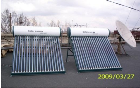
Рис. 5. Геліоколектори на даху головного корпусу ЧДУ ім. П. Могили