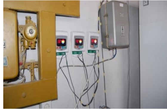
Рис. 6. Автоматизована система контролю за геліоустановкою

На головному корпусі університету планується встановлення вітрової установки, яка б працювала в комплексі з сонячною, забезпечуючи електричний підігрів води у баку-акумуляторі.