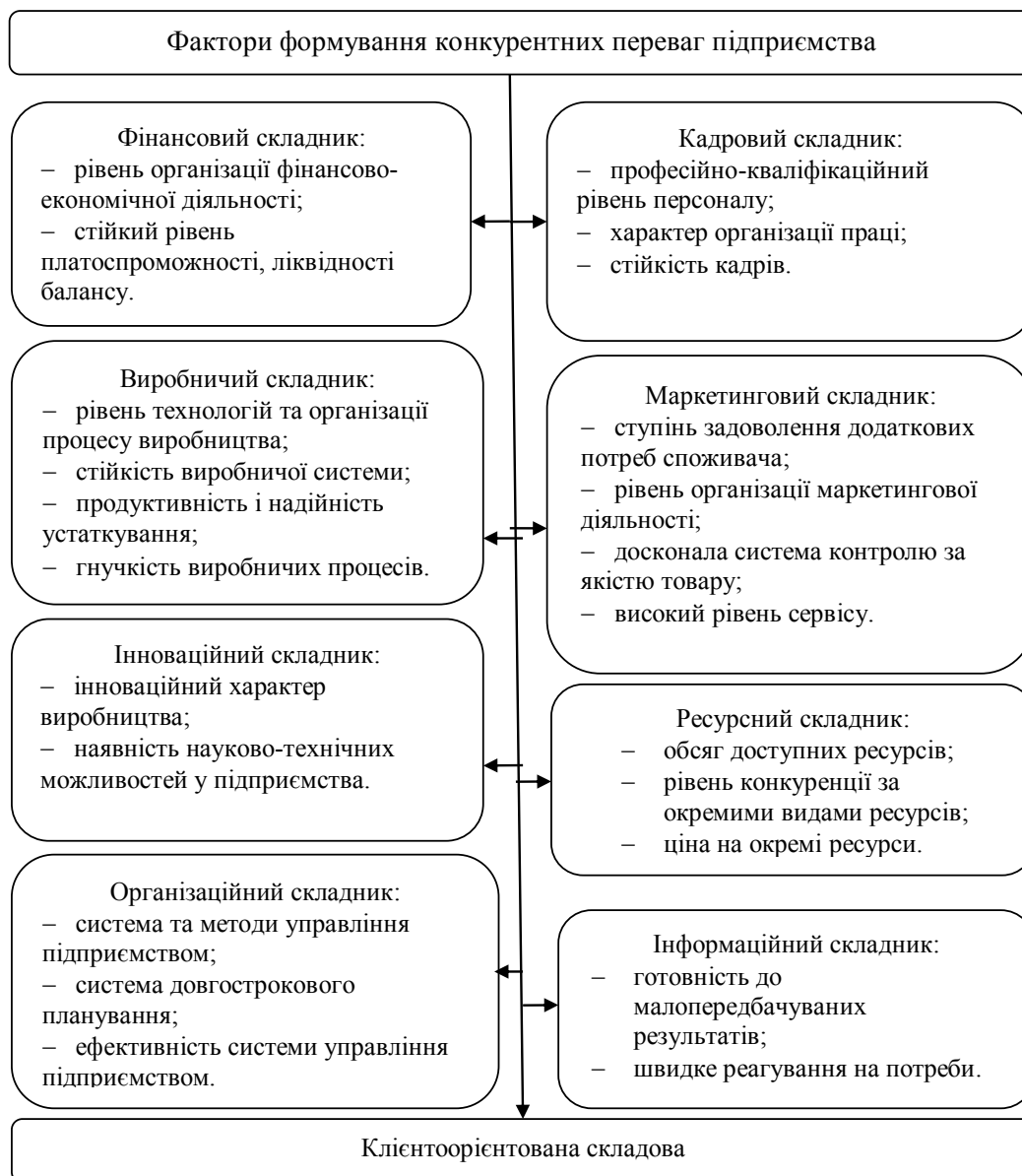
Рис. 3. Візуалізація факторів і зв'язків між ними, що впливають на формування конкурентних переваг