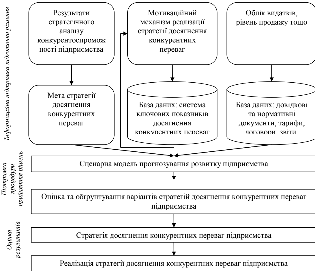
Рис. 4. Етапи інформаційно-аналітичної оцінки конкурентних переваг підприємства

переваг повинна спостерігатися інтеграція конкурентних та базових корпоративних положень підприємства. Сутність управління конкурентними перевагами підприємства полягає в забезпеченні механізму конкуренції, а зміст виражається в нормах і правилах функціонування підприємств у системі економічних координат. Основним фактором управління конкурентними перевагами підприємства є