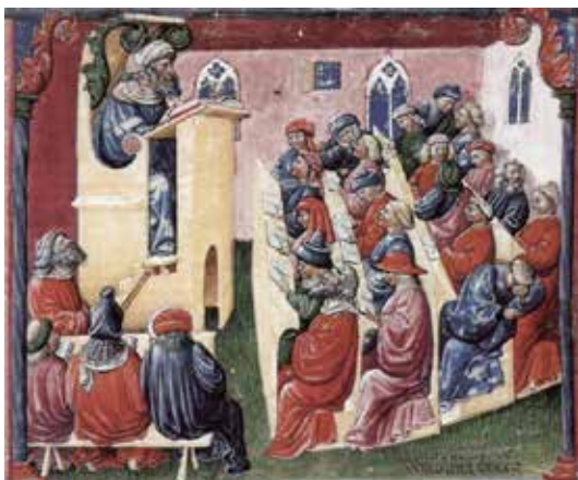
Рис. 4.4. Л. Вотолінський. Генріх Алеманський в Болонському університеті. Друга половина XIV ст.

Fig. 4.3. Unknown author. Teacher and students. French edition of «De proprietatibus rerum» by Bartolomeus Anglicus. 15th ct.