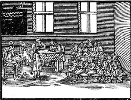
Рис. 4.7. Невідомий автор. Школа. «Orbis Sensualium Pictus» Я. А. Коменського. 1658.

Fig. 4.6. Unknown author. Town school. 1592.