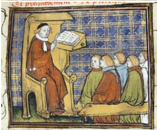
Рис. 4.3. Невідомий автор. Вчитель та учні. Французьке видання «De proprietatibus rerum» Бартоломея Англійського. 15 ст.

Fig. 4.2. Unknown author. Philosophy course in Paris. Grandes Chroniques de France. End of the XIV ct.