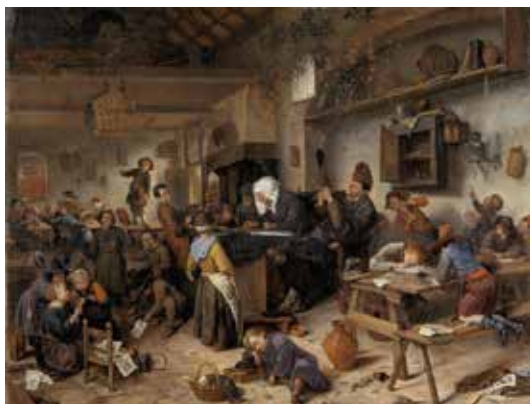
Рис. 4.8. Я. Стеен. Школа для хлопчиків і дівчат. 1670.

«Школа для хлопчиків та дівчат» (рис. 4.8). Великий клас, що зображено на картині, вочевидь, вже не є житловим примі-