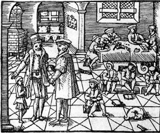
Рис. 4.5. Невідомий автор. Приватна школа в будинку вчителя. XVI ст.

Fig. 4.5. Unknown author. Private school in the teacher's house. XVI ct.