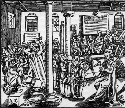
Рис. 4.6. Невідомий автор. Міська школа. 1592.

Fig. 4.5. Unknown author. Private school in the teacher's house. XVI ct.