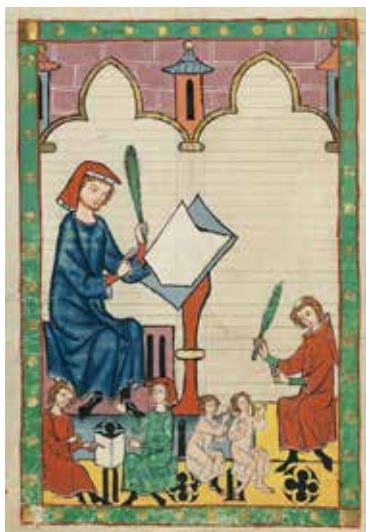
Рис. 4.1. Невідомий автор. Вчитель з Есслінгена. Манесьський кодекс. Перша половина XIV ст.

Розвиток масової освіти в Європі починається в часи пізнього Середньовіччя з появою як університетів, так і початкових цивільних шкіл (в першу чергу міських) (Боришанская, 1989). Основним візуальним джерелом щодо шкільного облаштування цього часу є книжкова мініатюра. Відомі ілюстрації дають досить характерну картину навчального приміщення з мінімальним обладнанням (рис. 4.1–4.3). Ці зображення стосуються здебільшого університетських класів, але можна припуща-