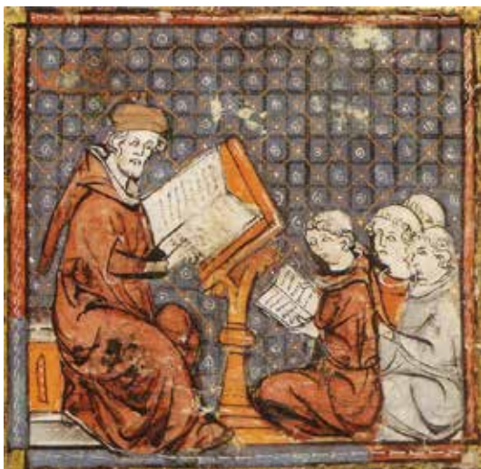
Рис. 4.2. Невідомий автор. Курс філософії в Парижі. Великі французькі хроніки. Кінець XIV ст.

Fig. 4.2. Unknown author. Philosophy course in Paris. Grandes Chroniques de France. End of the XIV ct.