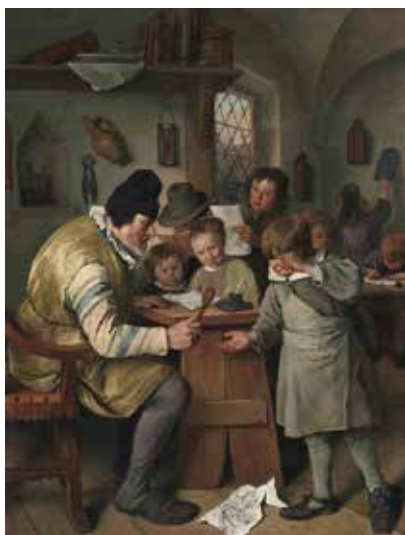
Рис. 4.9. Я. Стеен. Сільська школа. 1665.

щенням, а обладнано спеціально для потреб школи. Втім, меблювання класу, як і раніше, має скоріш спонтанний характер, а меблі за формами та конструкцією не відрізняються від побутових. Робоче місце вчителів обладнано столом та двома досить комфортними, але не парадними кріслами. Детальніше таке крісло видно на іншій картині Стеена, «Сільська школа» (рис. 4.9); подібне вчительське крісло бачимо і у Коменського (рис. 4.7). Приміщення захащено побутовими предметами, учні працюють за звичайними столами, сидючи хто на лавах, хто на стільцях, хто навіть на діжці. Видно, що меблі виконано за розмірами дорослої людини; для малолітніх учнів та учениць вони завеликі та незручні. Іншого облаштування клас не має, за виключенням невеликих полиць та деяких приладів (наприклад, пісочних годинників) на стінах. На стінах також розвішано невеличкі скриньки, що слугували учням за портфелі (два таких