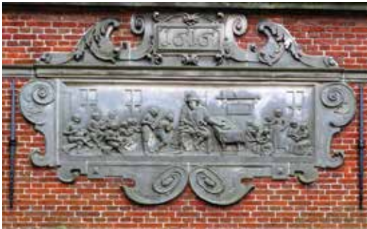
Рис. 4.10. Невідомий автор. Фасадний рельєф на будівлі сиротинця, Енкхейзен. 1616.

Картина Стеена дає чітке уявлення про організацію навчальної роботи: вона є не фронтальною, а індивідуальною, кожен з учнів чи учениць виконує (чи не виконує) власне завдання. Врешті, столи з двостороннім розташуванням робочих місць і не дають можливості для фронтального навчання. Такий підхід до організації навчання добре ілюструє текст «Порядку шкільного» – статуту Львівської братської школи 1586 року: «... [хлопці] учитися мають порізно, Псалтиря чи граматики з розв'язуванням її та іншим багатьом потрібним наукам, як визначите на той час, згідно з потребою; (...) хлопці мають самі писати на таблицях кожен свою науку, видану їм од дидака, окрім малих, яким має писати сам дидака» (Шинкарук, 1988, с. 40). Втім, для нідерландської школи характерним є спільне навчання хлопчиків та дівчат, хоча і з певними елементами просторової гендерної сегрегації: видно, що за столами працюють лише хлопці. Вочевидь, така сегрегація на той час була системною, що підтверджується й іншими зображеннями, наприклад фасадними рельєфами (gevelsteen) голландських будівель (рис. 4.10). На цих рельєфах добре видно, що хлопці та дівчата розміщуються в різних частинах приміщення, і хлопці мають кращі умови для роботи та більшу увагу вчителя. Подібне ставлення до просторової організації спільного навчання спостерігається в Європі досить довго, принаймні до XIX століття (Kühn, 2011).