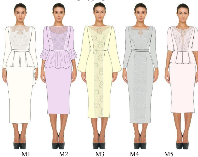
Рисунок 1 – Асортиментний ряд запропонованих вечірніх суконь