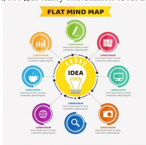
Рисунок 1 Приклад 2d інфографіки

В цілому, класифікація анімованої інфографіки досить умовна. Вона використовується або в професійному співтоваристві, або для опису замовником своїх побажань.