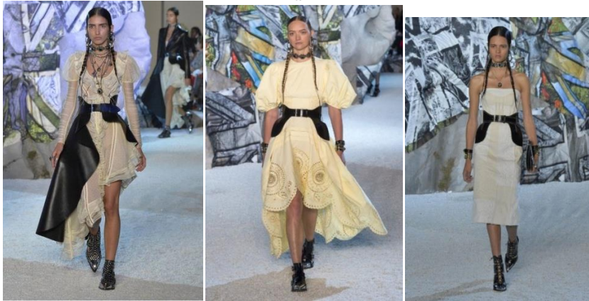
Рисунок 1 - Колекція Олександра Маккуїна весна-літо 2019 року

На прикладі одного жакету жіночого (рисунок 2) можна побачити, що за допомогою трансформації звичайний жакет можна доповнити декоративними деталями із натуральної шкіри (баска різної конструкції), а також за потребою змінити стиль – романтичний або мілітарі.