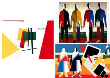
Рис.1 – Системно-структурний аналіз картин супрематистів

Для дослідження зображень картин супрематистів було використано системно-структурний аналіз. За допомогою проведеного аналізу виділено геометричні фігури, а також їх комбінування при створенні чоловічих костюмів у правильному між собою поєднанні кольорів. Кожна конкретна форма костюму – одягу, взуття, доповнень характеризується наступними первинними елементами: геометричним видом форми в цілому і її частинах; фактурою матеріалу; кольором і малюнком матеріалу форми; світлотінню форми; фізико-механічними властивостями матеріалу, форми та обробкою матеріалу. Зазначені властивості костюму, як об'ємно-просторові форми, не є постійними і можуть змінюватися у визначених межах. Результати зміни цих властивостей дають безмежні можливості їх сполучень.