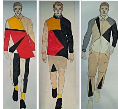
Рис.4. – Ескізи колекції чоловічого одягу

Згідно проведеного аналізу сучасних тенденцій в кольорі та декорі було виявлено ряд закономірностей, а саме: