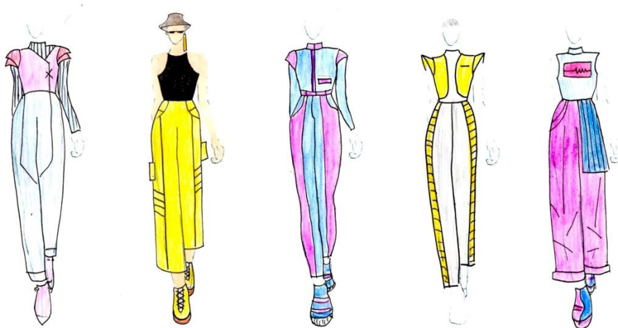
Рис. 2. Ескізи колекції молодіжного одягу з мотивами футуризму

За допомогою системно-структурного аналізу було виділено геометричні форми, лінії, пропорції, метро-ритмічну та статико-динамічну організацію (Рис.1). Трансформація цих елементів в одяг доцільна з точки зору вдосконалення пластики форми та художньої виразності майбутніх колекцій (Рис. 2).