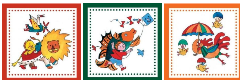
Рис. 6. Дитячі хустки з принтами модельної серії «Тридцять три зорі»