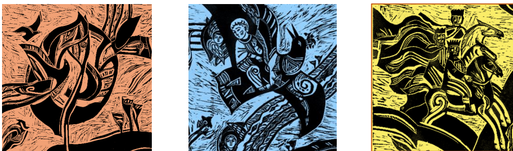
Рис. 1. Модельна серія хусток «Відлуння», декорованих ліногравюрами Н. Пшінки