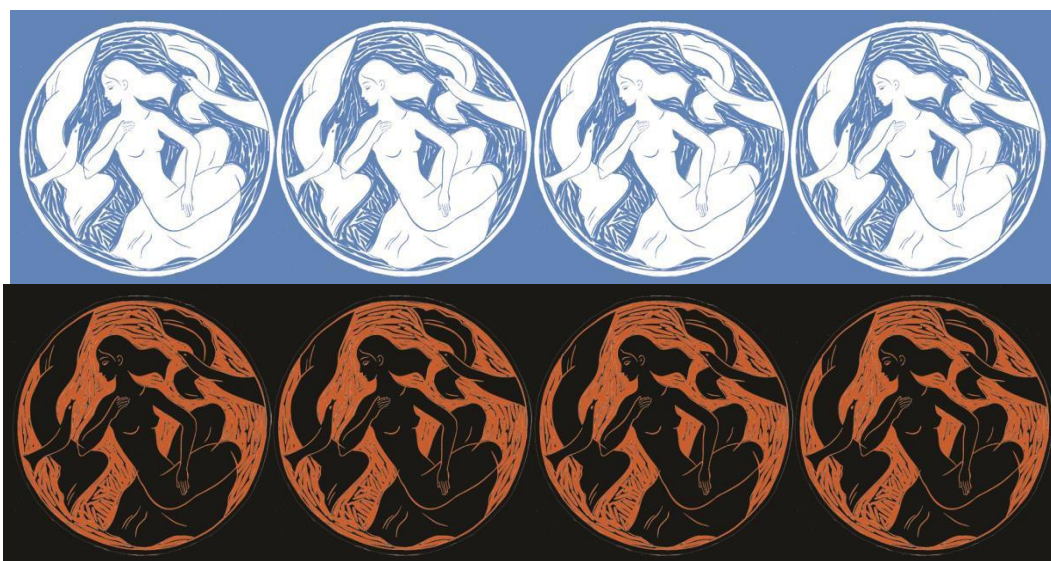
Рис. 2. Модельна серія парео «Птахи», декорованих ліногравюрами Н. Пшінки