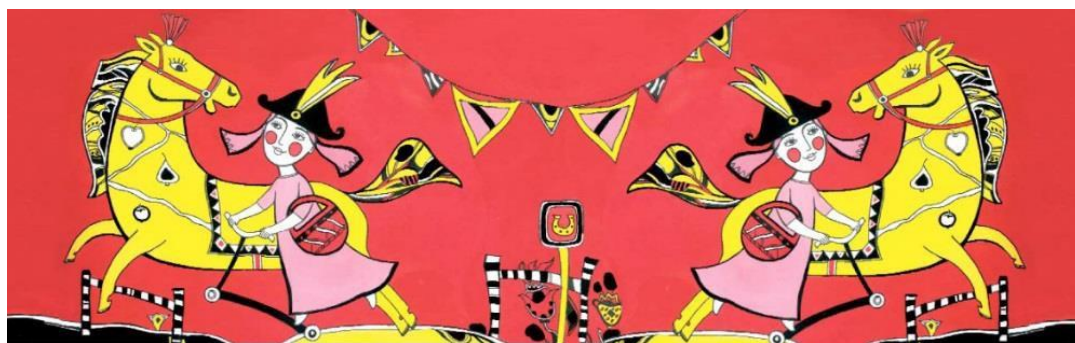
Рис. 5. Шарф з принтами модельної серії «Веселі малюки»