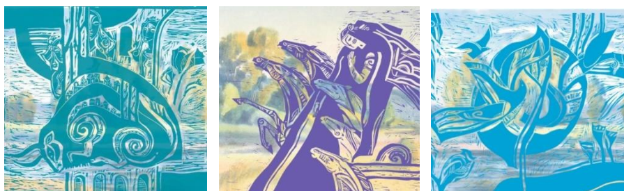
Рис. 7. Модельна серія хусток, декорованих комбінуванням лінонориту і цифрового друку