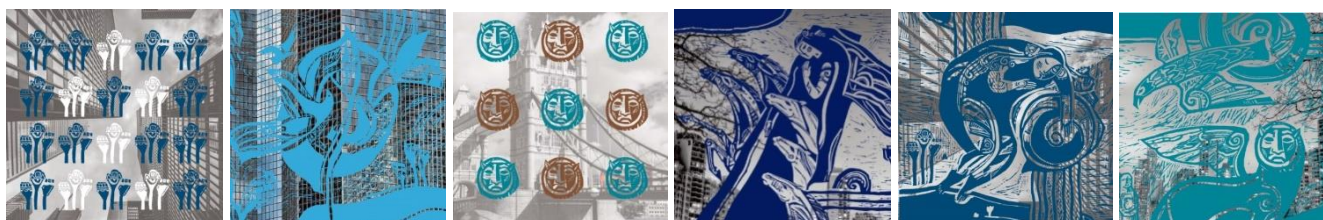
Рис. 8. Модельний ряд хусток, декорованих поєднанням фотографіки і ліногравюри