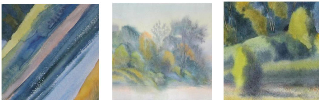
Рис. 4. Модельна серія хусток «Неповторність», декорованих принтами на основі акварельних пейзажів Н. Пшінки