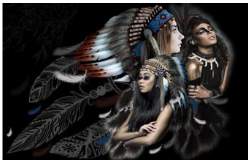
Рис. 5. Колаж творчого джерела для розробки колекції