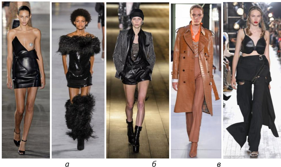
Рис. 1. Модель сукні бренду Saint Laurent (а), модель тренча бренду Burberry (б) та білизни бренду Helmut Lang (в) сезону SS19/20