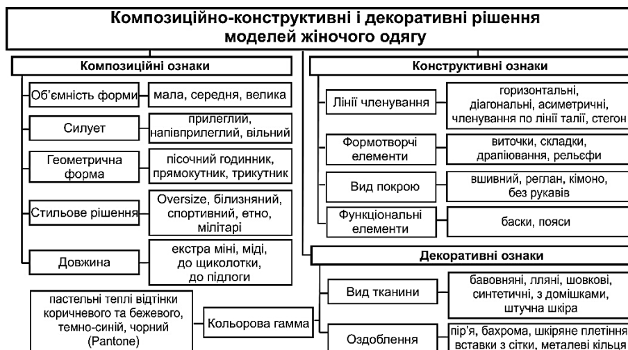
Рис. 2. Варіанти композиційно-конструктивного і декоративного рішень моделей жіночого одягу у відповідності до напрямку моди сезону SS19/20