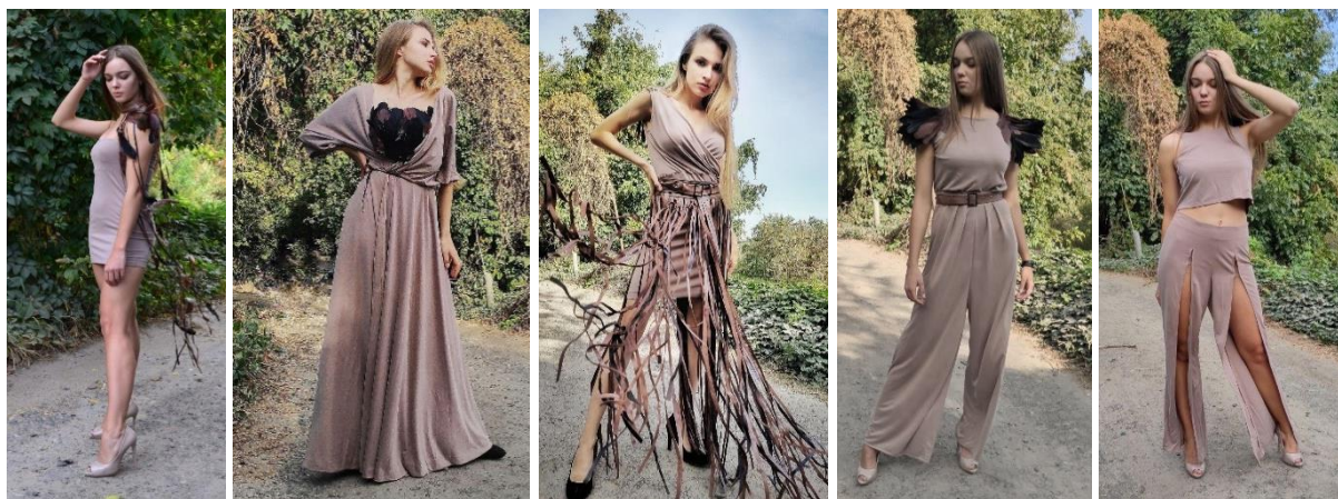
Рис. 9. Фото моделей одягу проектованої колекції «Сенс», автор Т.В. Пристав