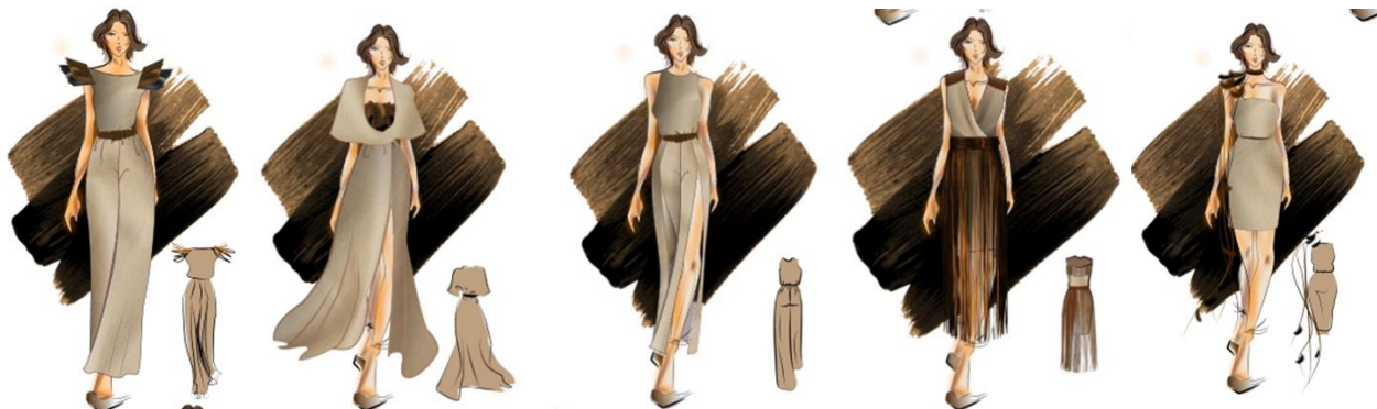
Рис. 7. Ескізи творчої колекції моделей жіночого одягу