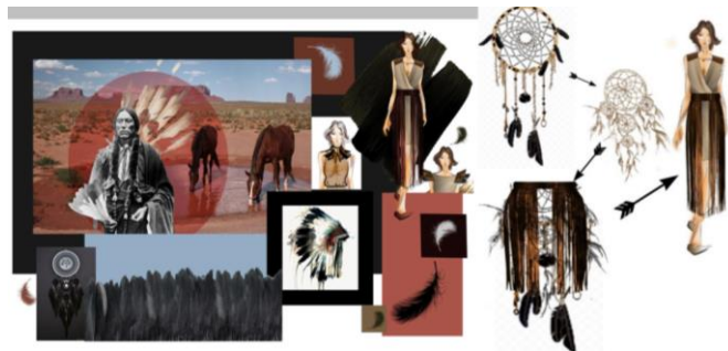
Рис. 6. Структурний аналіз та схема перетворення творчого джерела у костюмні форми колекції