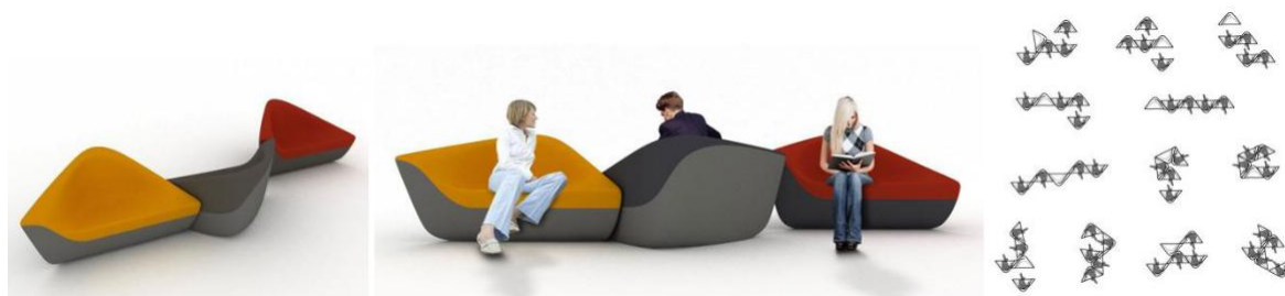
Рис. 3. Модульні м'які меблі «Walter Knoll» від «UNStudio» (Голландія)

Цей принцип можна спостерігати на прикладі української студії дизайну «ODESD2», яка представила модульну систему полиць, засновану на принципі «Єгипетського трикутника» (Рис.2). Елементи гарнітура утворюють геометричний візерунок і можуть компоуватися різними способами [5]. Прикладом такого підходу в графічному дизайні можуть бути піктограми і комікси, що складаються з безліч сприйманих окремо зображень, в той же час об'єднаних спільними смисловими зв'язками. Смайли і піктограми відносяться до «метамовних» знаків, оскільки вони володіють універсальністю зчитування і майже завжди зрозумілі носіям різних мов [6, с.7].