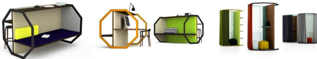
Рис. 4. Офісний модуль «Combo75»; дизайнер Арсеній Леонович

показник розглядається щодо вартості одного багатофункціонального виробу за одиницю продукції щодо суми вартостей декількох виробів, які виконують аналогічні функції окремо [2]. Отримання кінцевої композиції залежить від поставлених завдань. Чим більшій кількості функцій повинна відповідати форма, тим більш деталізованою є її опрацювання. У таких об'єктах важливим є вибір способу з'єднання модулів, особливо, якщо застосовується трансформація метою зміни форми виробу. Розробивши один модуль, дизайнер отримує як форму, здатну до самостійного існування, так і багатофункціональний обсяг, який при додаванні модулів (вузлів, деталей) ускладнюється. Розглянути даний аспект можна на прикладі офісних меблів «Combo75» (Рис. 4), що пропонує в якості відправної точки набір модулів, з яких можна зібрати будь-які композиції [8]. У графічному дизайні, особливо створеному для дитячого простору, це дуже актуально. Прикладом можуть бути зображення окремих букв і цілого алфавіту, супроводжуваних зрозумілими дитині образами. За допомогою таких картинок можна складати слова, придумувати історії і розвиваючі ігри.