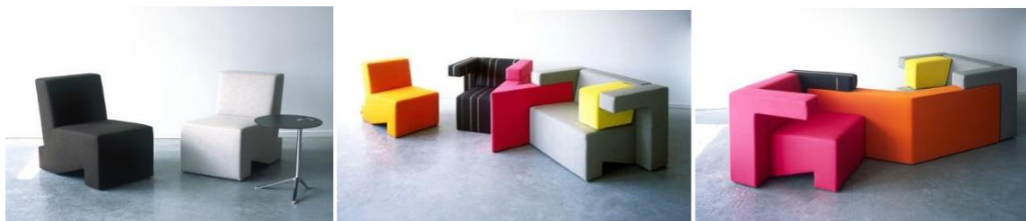
Рис. 5. Комплект м'яких меблів від «Studio Lawrence» (Голандія)

графічних елементів для складання цілісного графічного дизайну». В інтер'єрі прикладом клипарта можуть служити як окремі об'єкти (наприклад елементи меблів), так і зображення (фотографії) повністю» [9]. Якщо меблевий модуль не передбачає входження в систему будь-яких сторонніх елементів, то мотиви клипарта можуть поєднуватися з образами, створеними дизайнером самостійно.