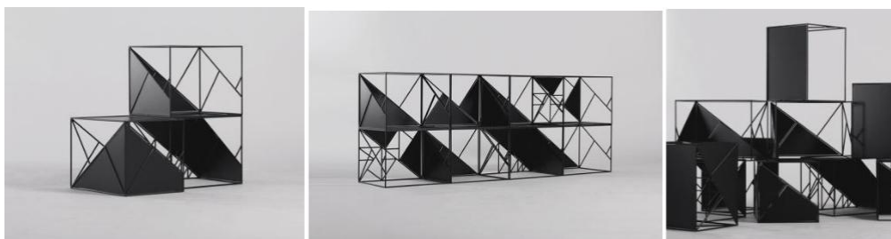
Рис. 2. Модульні меблі від української студії дизайну «ODESD2»

Дані модулі можуть використовуватися і додаватися поштучно, що актуально, наприклад, в дитячих приміщеннях з невеликою площею, оскільки саме в дитячому просторі цілісність є особливо важливою рисою середовища життєдіяльності, так як сприяє почуттю захищеності, стабільності і гармонії. Система «ReStyle» демонструє філософію сталого дизайну та ілюструє баланс і помірність, які є визначальними особливостями стійкості [4].