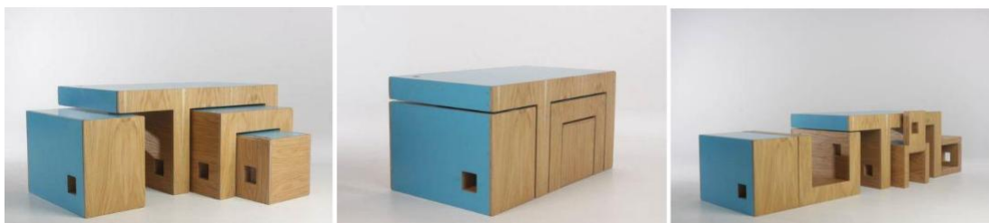
Рис. 1. Меблевий трансформер «ReStyle»; дизайнер Джеймс Хоулетт (James Howlett)

Цілісність і компактність форми ; передбачає єдність системи, що виникає як результат модульного проектування, а також конструктивну, технологічну і функціональну завершеність. Всякий раз, коли проектуються частини, необхідно думати про те, щоб вони сприймалися цілісно при трансформації в готовий виріб, адже тільки він може оптимізувати духовно-психічний стан людини і оцінюватися з естетичних позицій. Відповідно, модулю необхідна не тільки здатність до окремого існування, але і здатність до організації, яка досягається за рахунок продуманих структурних зв'язків з іншими елементами. Ця характеристика акцентується, наприклад, в меблевому трансформері «ReStyle» британського дизайнера Джеймса Хоулетта (James Howlett) (Рис. 1), який представляє з себе цілий кластер модульних предметів меблів і складається в більш ніж 40 різних конфігурацій.