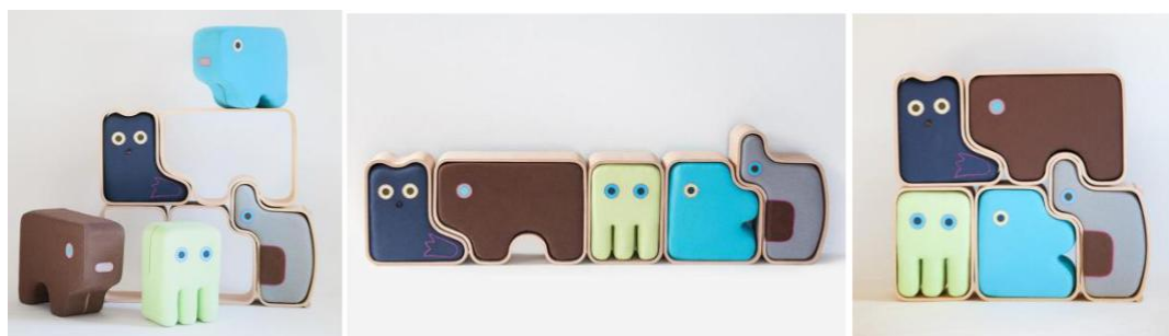
Рис. 8. Дитяча колекція меблів «Animaze» від міланської компанії «DesignLibero»; дизайнери Ekaterina Shchetina, Libero Rutilo

«Кадрові» зображення графічного дизайну, об'єднані спільною темою, які використовуються в інтер'єрі як окремо, так і разом, дають можливість простежити розвиток сюжету або придумати історію. З точки зору зовнішньої форми вони залишаються простими прямокутними елементами організації інтер'єру, тоді як образний ряд має власну логіку і може сформувати різні сюжети, що призведе до індивідуалізації простору.