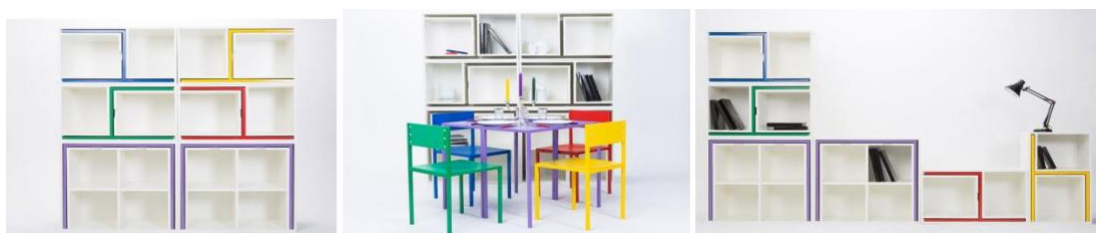
Рис.7. Модульні меблі від дизайнера Orla Reynolds (Ірландія)

Спеціалізованість форми виникає в результаті урахування її інтерактивного освоєння споживачем. Використовуючи модульні рішення, людина розбереться тільки в зрозумілих їй елементах і складе їх, виходячи з власних потреб. Це призводить до більш високого ступеня раціональності дизайну і, в свою чергу, забезпечує індивідуалізацію форм. Як приклад можна привести колекцію модульних меблів від дизайнера Orla Reynolds (Рис.7). Фрагменти багатofункціональної пластикової книжкової шафи (в яку вбудовані 2 столи і 4 стільця) можуть бути розставлені як у вигляді класичного прямокутника, так і в лінію, уздовж однієї із стін в квартирі. У поєднанні з кольором і з урахуванням різноманітності рішень знеособленість простих форм зникає, і після перестановки вони стають неповторними саме для споживача, тобто в процесі інтерактивної взаємодії з предметом [11].