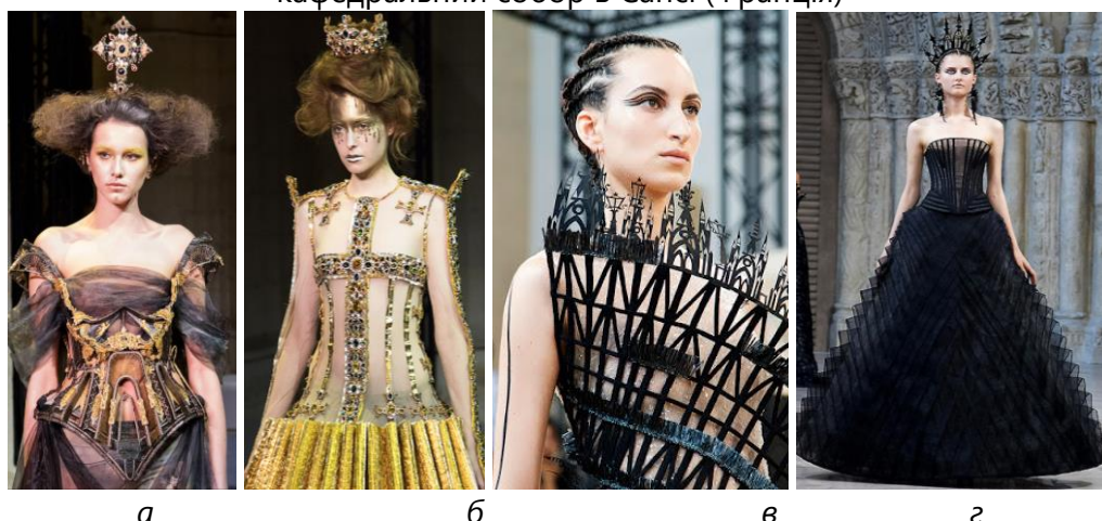
Рис. 3. Колекції дизайнера Guo Pei: а, б – «Легенда» (2017 р.); в, г – «Архітектура» (2018 р.)

Як приклад різного підходу к інтерпретації готичного архітектурного стилю можна навести колекції дизайнера Guo Pei 2017 та 2018 років. За словами авторки джерелом натхнення цих колекцій була готична архітектура середньовічних