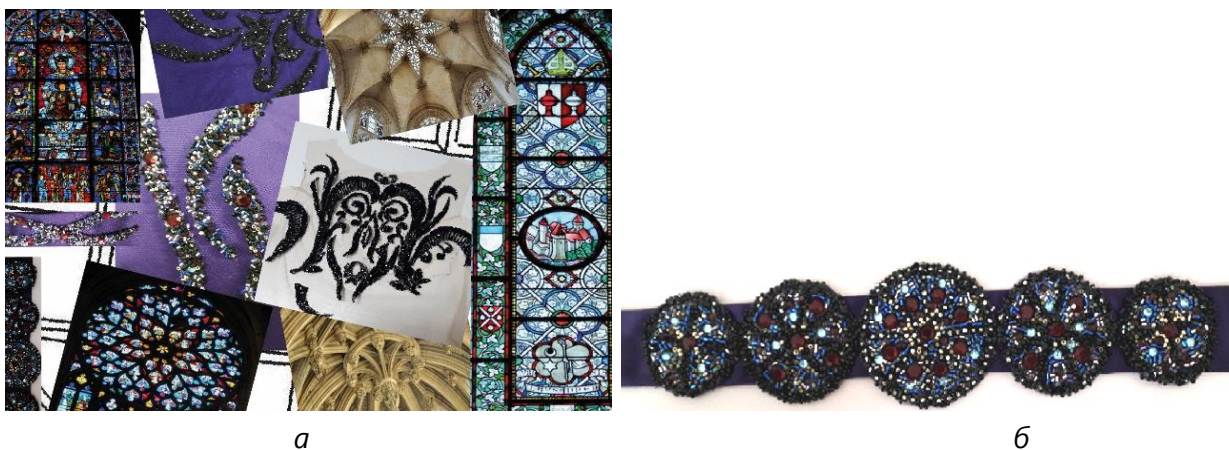
Рис. 5. Творчий пошук та розробка оздоблення колекції: а – пошук визерунків для вишиваних композицій; б – елемент оздоблення поясів суконь колекції «Чарівна мить»