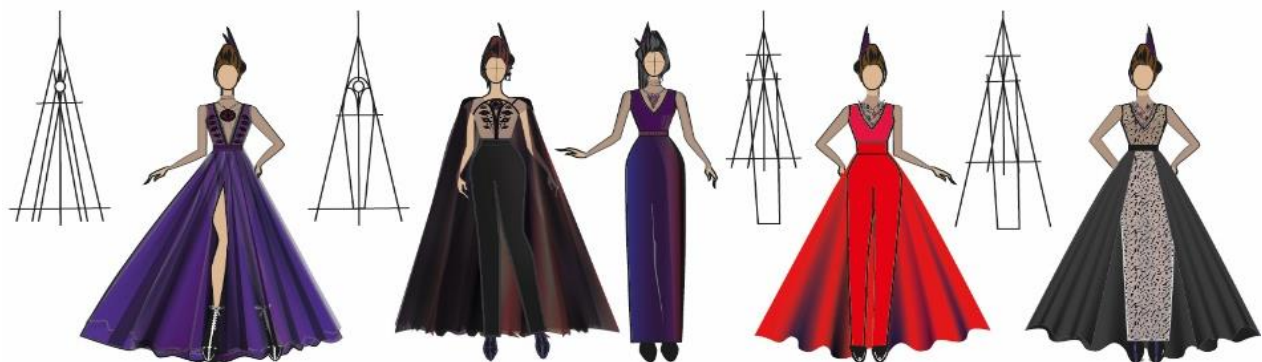
Рис. 6. Творчі ескізи колекції жіночого одягу «Чарівна мить» за мотивами готичної та неоготичної архітектури