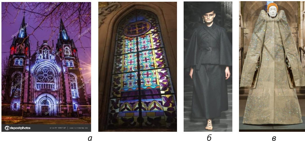
Рис. 4. Моделі за мотивами готичного архітектурного стилю: а – творче джерело; б – Christian Dior (2019 р.); в – Viktor & Rolf (2000 р.)

мереживом. Вишивки імітують абриси та структури стрілчастих вікон готичних храмів (рис. 6).