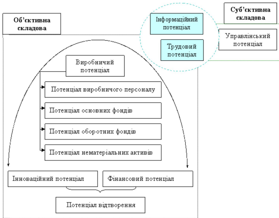
Рис.1. Структура потенціалу автотранспортного підприємства