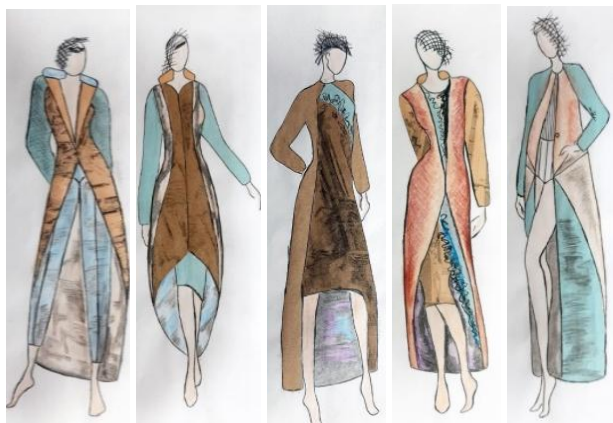
Рис. 2. Ескізне рішення авторської колекції «Неоготика»

На основі вивчення теми дослідження – художньо-композиційних особливостей стилю «неоготика» в архітектурі, а також за отриманими даними системно-структурного аналізу, методів класифікації та візуального порівняння, одержані варіанти проектних рішень асортиментних блоків різного призначення колекції молодіжного одягу «Неоготика» (рис. 2).