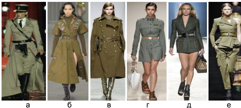
Рис. 1. Моделі одягу в стилі мілітарі: а - Christian Dior; б - Temperley London; в - Daks; г - Fay; д - Versace; е - Balmain

Основними ознаками стилю мілітарі в одязі є: колірна палітра (хакі, зелений, сірий, коричневий, пісочний, камуфляжна палітра); деталі (погони, лампаси на штанах, накладні кишені з клапанами, кокетки, хлястики, хомутики, манжети); аксесуари (головні убори, тематичні нашивки із військовою символікою у вигляді орденів, значки, пояси, шкіряні ремені з масивними «бляхами», сумки, взуття); оздоблення та фурнітура (шеvronи, нагрудні знаки, металеві ґудзики з армійськими символами, шнури, текстильна тасьма) (рис. 1) [1-2].