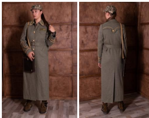
Рис. 3. Жіночий ансамбль «Пентесілея» (автор Журавльова Х., 2019 р.)

Використовуючи рекомендації експертів, розроблено жіночий ансамбль в стилі мілітарі під назвою «Пентесілея» [4] (рис. 3).