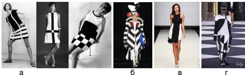
Рис. 4. Колекції: а - Мері Куант 1960-і рр., б - Крістіан Діор 2002 р., в - Даша Гаузер 2012 р., г - BALMAIN 2020 р.

Колористичні рішення одягу, побудовані на різких контрастах чорного і білого, формально і стилістично уподібнювалися зразкам Малевича, представленим на виставці 1915 р. Вражаюче ефектні у 60-х роках ХХ ст., вони до кінця століття не втратили актуальності і залишаються у сучасному дизайні колекцій Діора, Гаузер, Бальман (рис. 4).