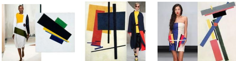
Рис. 5. Приклади прямого звернення до композицій супрематизму К. Малевича в дизайні одягу

Кольорові композиції Малевича піддаються як прямому «цитуванню», так і стилізаціям, де супрематичний образ зазнає суттєвих перетворень, розкладанню на окремі елементи, розшаруванню кольорів на фрагменти.