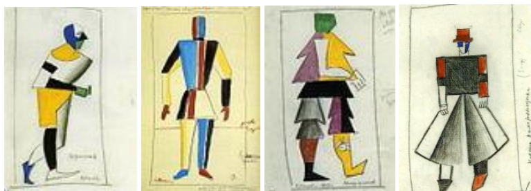
Рис. 2. Ескізи костюмів до опери «Перемога над сонцем»