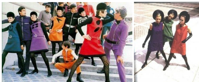
Рис. 3. Колекції: а - П'єра Кардена б - Андре Куррежа, 1964 р.

Наприкінці 50-х років європейські модельєри продемонстрували новачії, які порушували сталі традиції та канони. Це були короткі та ультра короткі сукні, мінімалістичні форми костюмів та верхнього одягу, геометричне оздоблення, контрастні поєднання гладко фарбованих тканин. Так, Коко Шанель запропонувала мінімалістичний костюм-двійку, П'єр Карден – лаконічний «унісекс», Мері Квант - сенсаційно короткі форми спідниць. У 60-і роки після першого польоту людини в