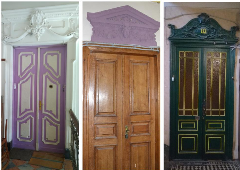
Рис. 1. Квартирні двері, перефарбовані у нехарактерні для інтер'єру кольори