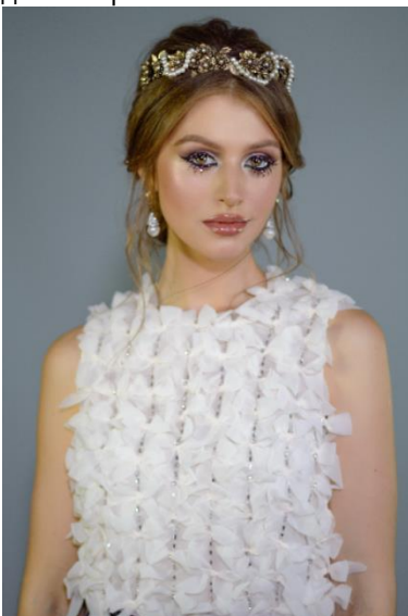
Рис. 5. Вечірній тематичний образ «В італійському дусі». Грим, стиль: А. Шаркіна. Фото: С. Смульська, 2020 р.