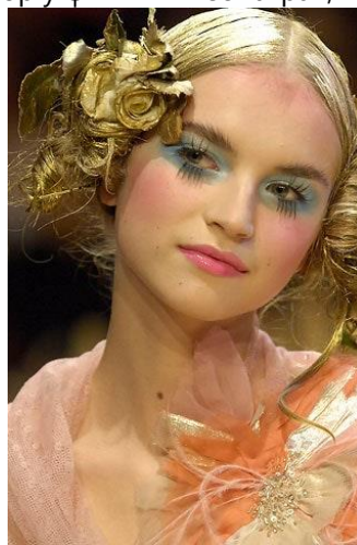
Рис. 4. Модель з колекції SS 2008, дизайнер John Galliano