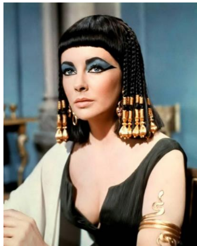
Рис. 2. Образ Клеопатри у виконанні Елізабет Тейлор у фільмі «Клеопатра», 1963 р.