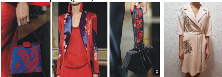
Рис.1. Декоративне оздоблення одягу та аксесуарів

Результати досліджень. Вишивка широко використовується в різних стилях одягу. Бренди, які працюють в напрямку Couture (Dolce&Gabbana, Armani, Gucci, ManoloBlahnik) використовують вишивку в своїх колекціях на одязі, взутті та аксесуарах. Такий вид оздоблення демонструє складність та унікальність виробів (рис.1).