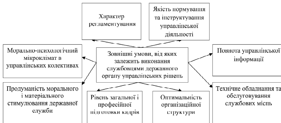
Рис. 2. Зовнішні умови, від яких залежить виконання службовцями державного органу управлінських рішень

Тому виконавська дисципліна — це, насамперед, виконання співробітниками наказів, розпоряджень, рішень, вказівок, прийнятих на вищому рівні управлінні. У системі державного управління в даному випадку необхідно вести мову про виконання нормативних правових актів вищих органів і посадових осіб. У системі державного управління поняття "доручення" вживається в декількох контекстах. По-перше, доручення розуміється як особливий різновид завдання, який може давати-