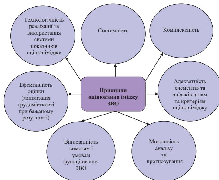
Рис. 2. Принципи оцінювання іміджу закладів вищої освіти

Важливу роль при оцінці іміджу вищих начальних закладів відіграють принципи оцінювання (рис. 2).