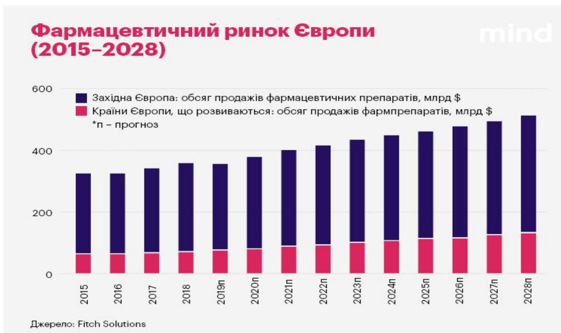
Рис.1 Прогноз зростання обсягу продажів фармацевтичних препаратів в Європі з 2015р. по 2028 рік

найближчі роки збережеться: до 2023 року фармацевтичні продажі в Європі виростуть на 21,6%, до $438,6 млрд, тоді як в Україні – на 36,4%, до $4,26 млрд. [2]