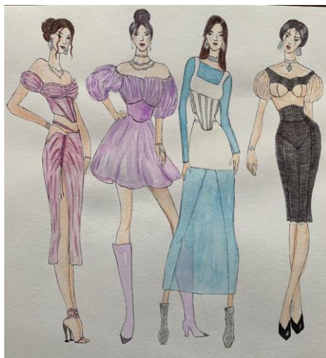
Рис. 2. Ескізи моделей колекції жіночого одягу на основі трансформації елементів костюма стилю бідермаєр

При розробці ескізів (рис. 2) використано пластику формоутворюючих ліній, художньо-колеристичне вирішення, доповнюючі елементи, принципи декорування костюма історичного костюма. Сучасні технології дають можливість виготовити сукні, які будуть функціональними та комфортними в носінні.