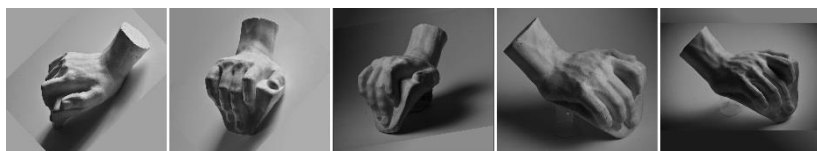
Рис. 2. Серія фотографій гіпсової моделі «Кисть руки» з різних ракурсів.

Наступним етапом може стати виготовлення точних 3-д цифрових моделей для роботи та вивчення об'ємів дистанційно. Такий віртуальний каталог дозволить кожному студентові детально вивчити пластику та особливості побудови форми, відкриває можливості для авторської специфіки індивідуального опрацювання деталей, тощо, а це надважливо зокрема у скульптурному моделюванні, копіюванні, та проектуванні.