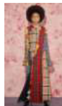
Рисунок – Використання «апсайклінгу» в колекціях жіночого одягу провідних дизайнерів

Підготовка майбутніх фахівців з професійної освіти до проектування та виготовлення сучасного одягу має включати і підготовку до модернізації та переробки швейних виробів, що були у вжитку і вийшли з моди. Теоретична підготовка передбачає аналіз студентами наукових джерел з проблеми «сталого дизайну» і «апсайклінгу», вивчення переваг та потенційних ризиків при використанні технології, розгляд успішних кейсів застосування технології в Україні). Практична підготовка може здійснюватись шляхом проведення майстеркласів з «апсайклінгу» та розробкою студентських проєктів із застосуванням «апсайклінгу». Стимулом до використання технології «апсайклінгу» може бути проведення конкурсу студентських робіт у закладі вищої освіти.