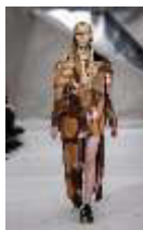
Marni, осінь-зима 2020