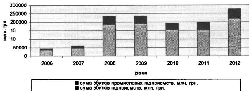
Рис. 3. Розподіл суми збитків промислових підприємств України у загальній їх кількості (побудовано автором на основі табл. 2)

На рис. 3 відображено розподіл суми збитків підприємств України та виділено суми збитків окремо промислових підприємств.