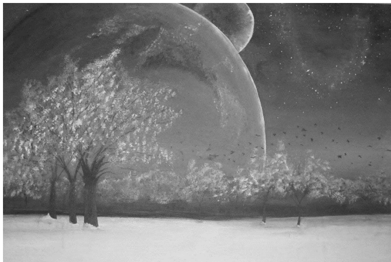
Рис. 2. Джерело натхнення авторської колекції одягу

При дизайн-проектуванні авторської колекції жіночого одягу з використанням авторських малюнків на тканині, творчим джерелом обрано поєднання асоціативних елементів джерела натхнення картина «Зимовий пейзаж» (рис. 2). Шляхом поєднання асоціативних елементів джерела натхнення розроблено авторські малюнки для колекції жіночих курток з плащової тканини (рис. 3).