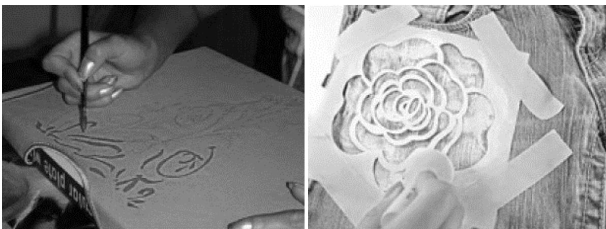
Рис. 1. Зразок нанесення малюнків на одяг трафаретною технікою

Особливості трафаретної техніки виконання розпису по тканині є застосування трафаретів або шаблонів. Дана техніка розпису є однієї з найпростіших і зрозумілих, оскільки все, що потрібно – це виготовити трафарет за авторською ідеєю зі щільного картону, надійно закріпити його на поверхні тканини та за допомогою підготовленої палітри та спонжу нанести фарбу на матеріал (рис. 1).