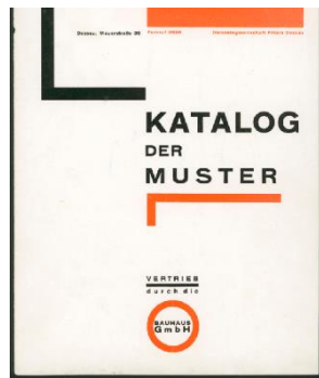
Рисунок 2 - Логотип Баухауса, розроблений Оскарор Шлеммером.