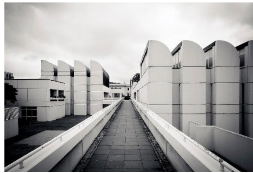
Рисунок 3 – Державний архів та Музей дизайну у Берліні.

Вибір ідеї для розробки колекції спрямовано на стиль мінімалізму, який прослідковується у всіх витворах мистецтва цієї школи, що в свою чергу надають схожі характеристики новій колекції. Також в архітектурі, як в джерелі натхненні, приділяється більше уваги красі простоти і виразності ліній (рис. 4).