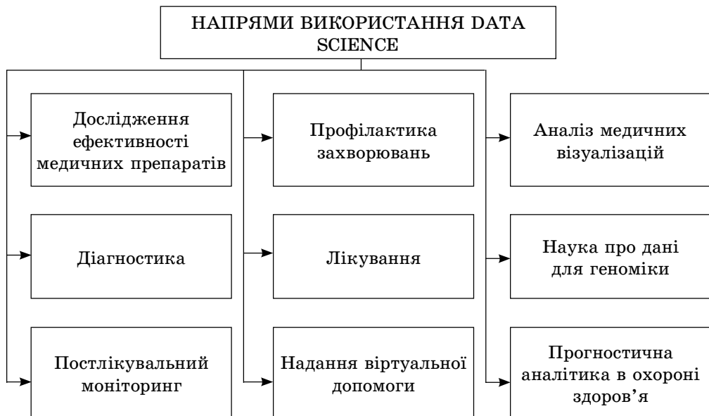
Рис. 2. Напрями використання методів Data Science у сфері охорони здоров'я [6, 7]

Використання методів Data Science в медичній сфері дозволяє оптимізувати процеси розробки медичного обладнання та лікарських препаратів, удосконалити методи лікування та профілактики, підвищити ймовірність коректного встановлення діагнозу тощо. У даному випадку завдяки застосуванню алгоритмів машинного навчання вдається підвищити ефективність та нівелювати людський фактор.