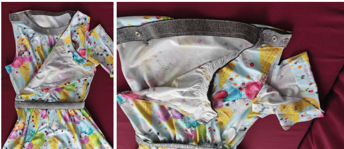
Рисунок 4 – Функціональні елементи готового виробу

трикотаж переплетення гладь (рис. 4), як такий що задовольняє вимогам повітропроникності, має найменшу вагу та товщину полотна, а також високі формостійкі властивості.