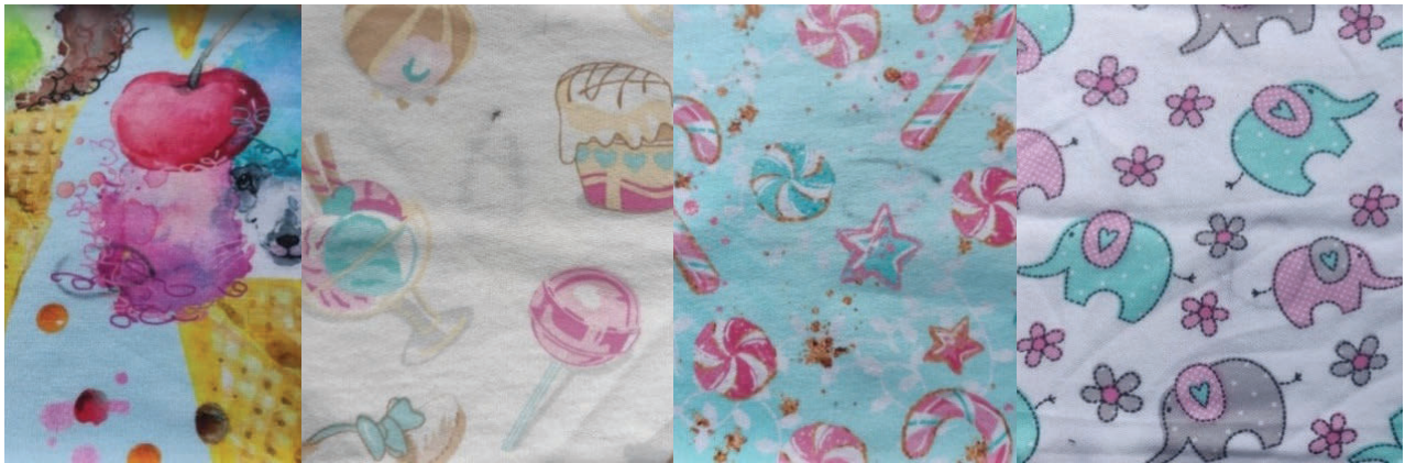
Рисунок 2 - Фото трикотажних полотен для виготовлення дитячої колекції

Для підтримки чистоти та гігієни одягу слід передбачити, що запропоновані вироби підлягатимуть частим пранням. Тому матеріали повинні бути легкими у догляді та зберігати основні лінійні розміри при пранні. Крім того, усадка трикотажу є негативним явищем, так як впливає на зміну форми і розмірів виробів,