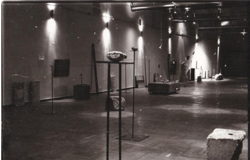
Рис. 2. Вигляд експозиції виставки «Ієрархія простору». 1992