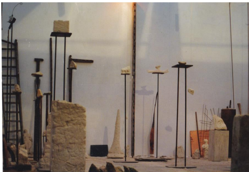
Рис. 1. Семінар «Азбука». Фото майстерні скульптора О. Сухоліта. 1992