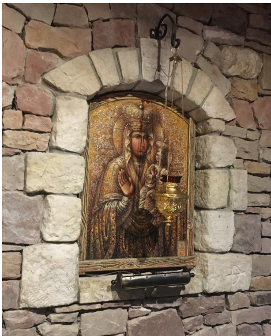
Рис. 3. Копія ікони Зарваницької Божої Матері (автор Є. Овчарик), Церква Святої Хатини Марії Діви з Назарету