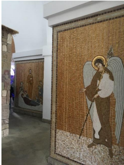
Рис. 1. Фрагмент мозаїки храму Святої Хатини Марії Діви з Назарету