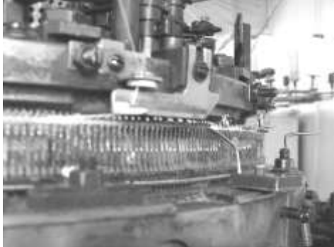
Рис.3. Додатковий прутковий механізм

При використанні пресового способу з'єднання додатковими нитками нормалізація процесу петлетворення досягається лише при встановленні пруткового механізму в проміжку між фонтурами (рис. 3) в зоні після утворення з'єднувальних накидів і до моменту виконання операції замикання в системі утворення одного з шарів двошарового трикотажу.