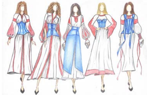
Рис. 3. Авторська колекція суконь в етно стилі