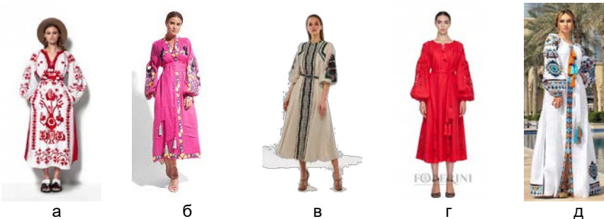
Рис. 2. Етно сукні українських брендів: а - Vita Kin, б - Yuliya Magdych, в - Roksolana Bogutska, г – FOWERINI, д – Plahta