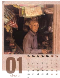
Рис. 2. Вінтажний календар