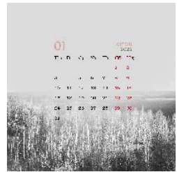
Рис. 3. Проєкт календарної сітки