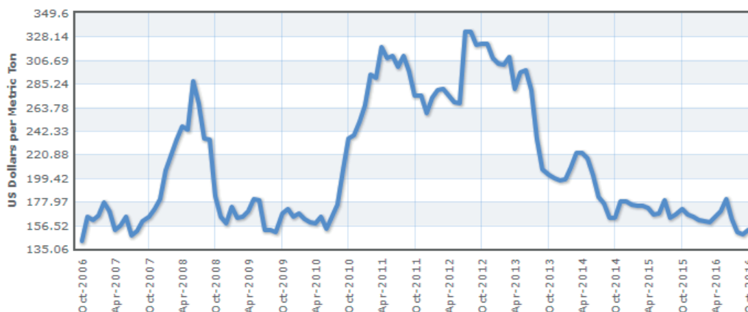
Рис. 3. Динаміка цін на кукурудзу за 2006-2016 рр. [9]

Для оптимізації системи зернового маркетингу українські сільськогосподарські підприємства можуть скористатись таким інструментом як товарна біржа. При виході на зовнішні ринки, доцільно дослідити можливості щодо розміщення пропозиції про продаж зернових на одній з товарних бірж країн ЄС, що спеціалізуються на продажі сільськогосподарської продукції (таблиця).