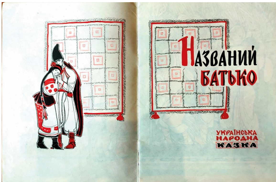
Рис. 2. Оформлення титульного розвороту дитячої книжки «Названий батько» у виконанні Надії Лопухової (Видавництво дитячої літератури «Веселка», Київ, 1967, техніка ілюстрацій – акварель, олівець).