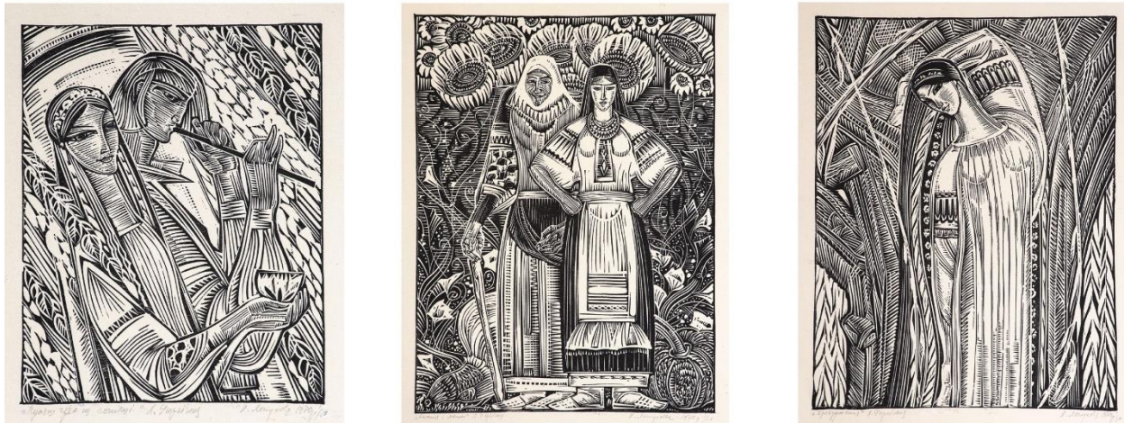
Рис. 3. Ілюстрації Надії Лопухової до драми-феєрії Лесі Українки «Лісова пісня» (Видавництво художньої літератури «Дніпро», Київ, 1970, техніка ілюстрацій – лінорит).

казки О. Іваненко «Кисличка» («Дитвидав», 1962), що позначило новий рівень художньої майстерності Н. Лопухової – емоційно насичений, життєрадісний, щиро-проникливий.