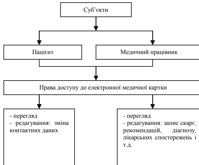
Рис. 2. Структура прав доступу суб'єктів до ПМДн

Взаємозв'язок суб'єктів та відповідних їм вповноважень над об'єктами і конфіденційними даними показаний на рис. 2.