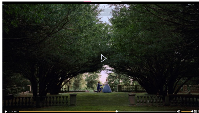
Рис. 2 Центральна композиція з обрамленням об'єктів у форму

Звернемо увагу та колір. Закон колірної та тонового контрасту в композиції кадру та об'єктів в ньому має дещо іншу дію, ніж у природі або суспільній свідомості. Якщо в природі закон контрасту діє невідворотно, як одночасна боротьба протилежностей і їх діалектична єдність, то в мистецтві художник вільний у виборі тотожності, нюансу чи сенсового контрасту. При вивченні явищ контрасту з наукової точки зору виділяють два аспекти проблеми: психофізіологічний та естетичний. Колірна гармонія, колорит, світлотінь побудовані за принципами контрасту. Оскільки контраст також має великий вплив на композицію фото та відео зображень, варто виділити основні сім типів колірних контрастів: