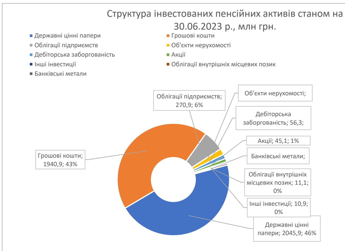
Рис. 1. Структура інвестованих пенсійних активів на 30.06.2023 р., млн. грн.

Недержавні пенсійні фонди в Україні займають важливе місце у системі соціального захисту. Вони сприяють вдосконаленню пенсійної системи через впровадження другого рівня пенсійної реформи.