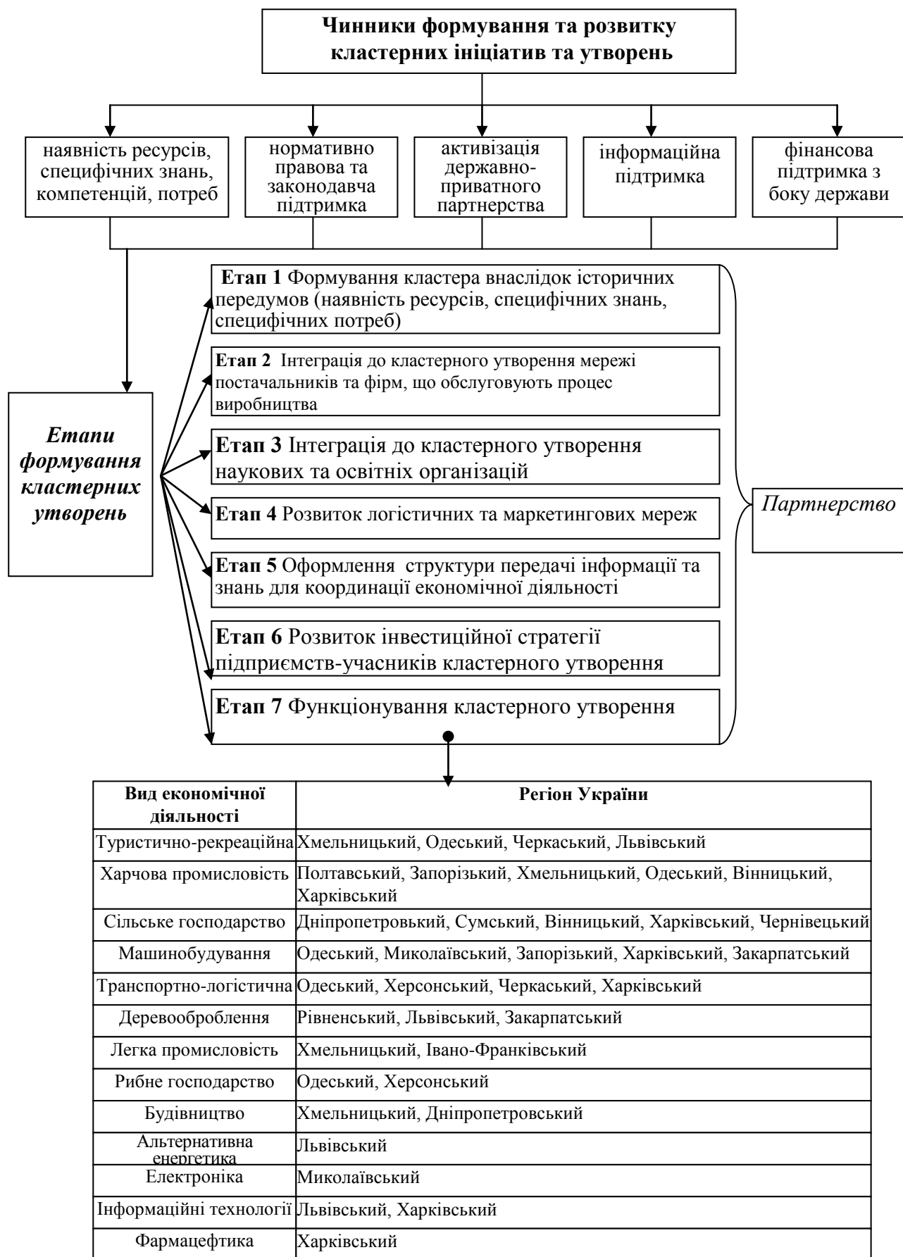
Рис.1. Структуро-функціональна схема партнерства на основі кластерного підходу (розробка автора)