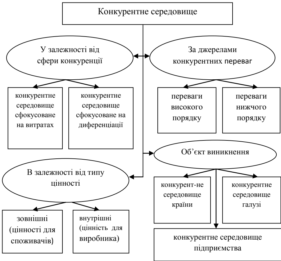
Рис. 1. Класифікація конкурентного середовища.

Тому позитивний конкурентний фон характеризується наявністю в ній механізмів формування умов і засобів, які сприяють вирішенню завдань загальнонаціональної безпеки, економічного розвитку та підвищенню рівня життя населення. Проаналізуємо високорозвинені країни світу, які є ключовими інноваторами - США, Фінляндія, Сінгапур, Тайвань, Австралія, Швеція, Швейцарія та Канада. Середня оцінка загального індексу конкурентоспроможності складає — 5,46, індекс суспільних інституцій — 5,98 та індекс макроекономічного середовища — 4,98. До високорозвинених країн світу долучилися і постсоціалістичні країни — Естонія, Словенія та Угорщина. До неконкурентоспроможних країн можна віднести ряд південноафриканських та латиноамериканських країн та Україну [1].