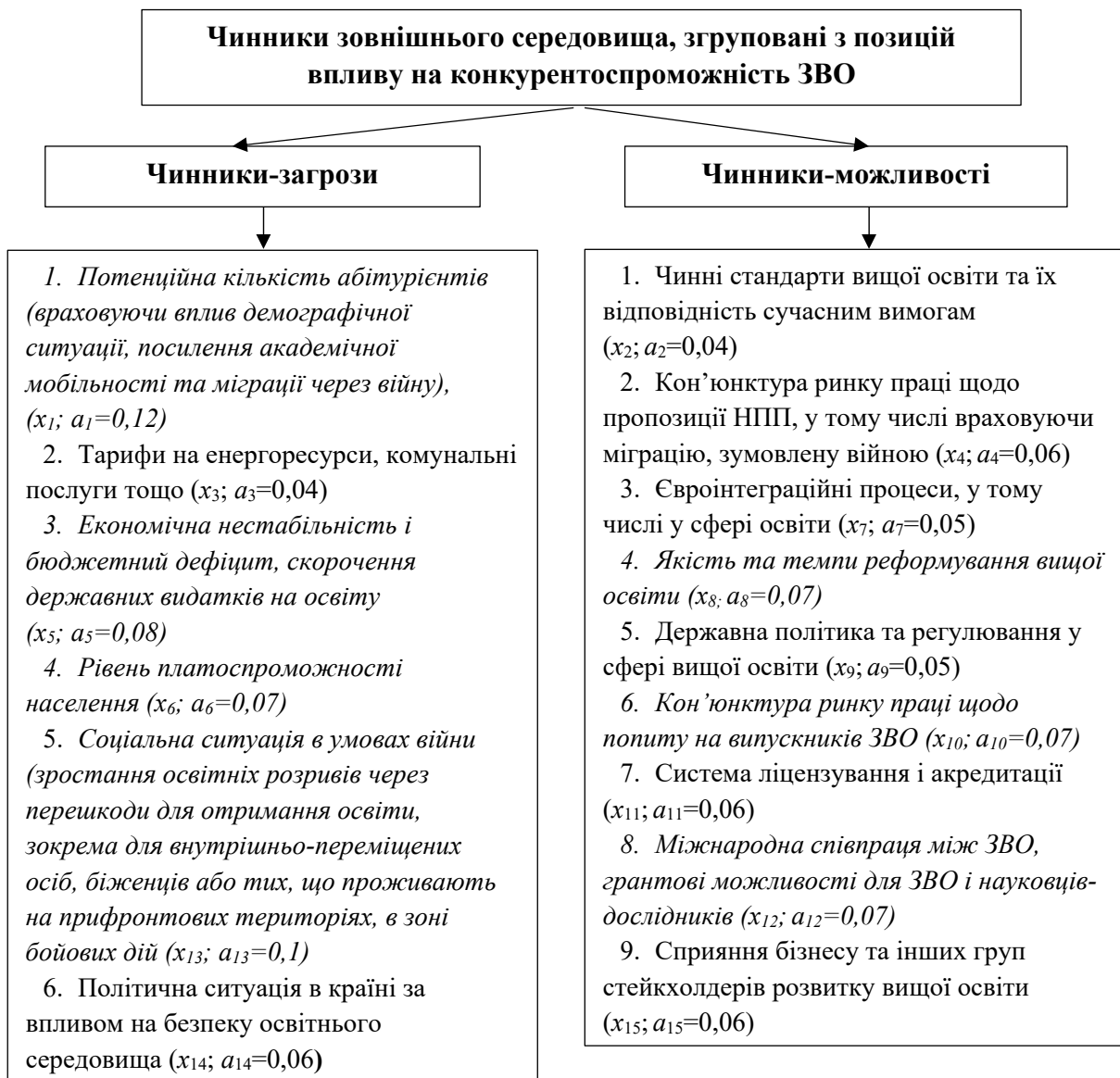
Рис. 1. Система чинників зовнішнього середовища закладів вищої освіти України у 2023–2024 навчальному році

Необхідно відзначити, що застосування шкали бажаності при оцінюванні впливу чинників зовнішнього середовища на рівень конкурентоспроможності ЗВО обумовлено її перевагами як методу стандартизації показників завдяки можливості побудови узагальнюючого показника стану зовнішнього середовища шляхом згортання множини різновекторних чинників в єдиний показник з використанням деякої безрозмірної шкали, яку запропонував Е. Харрінгтон [11]. В процесі даного дослідження автори виходили з припущення, що рівнем бажаності є деяке перспективне (бажане) значення натурального показника, яке відповідає встановленим значенням шкали бажаності — найвищому рівню можливостей або найнижчо-