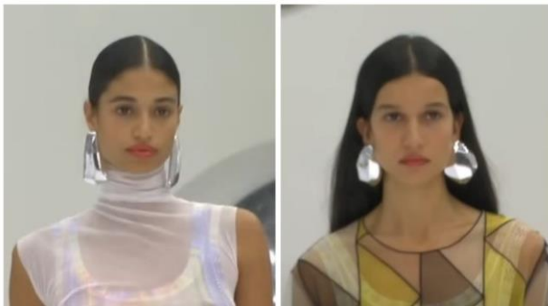
Рис. 4. Missoni | Spring Summer 2024 | Full Show