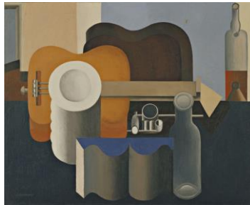
Рис. 1. Ле Корбюзьє “Натюрморт”, 1920

Пуризм у широкому розумінні є захистом канонічності, дотримання чистих зразків у мистецтві, мові та інших сферах. Пуристичний живопис характеризується такими ознаками: