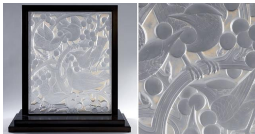
Рис. 2. Дрозди та виноград (деталі). Панно, дизайн Рене Жуля Лаліка, виготовлено скляним заводом Lalique. Франція, 1928. Музей Вікторії та Альберта, Лондон.

Після пуризму настав час іншого не менш відомого стилю – арт-деко. Арт-деко – стиль, який охоплював 1920 роки ХХ ст. та прославився збереженням традицій одночасно пробуючи їх поєднати з складною сучасністю. Сам термін “Арт-Деко” є скороченням з французької “декоративне мистецтво”. З’явився в 1960-х роках та є міксом часів до того та новим авангардом, старовинними несхожими культурами, народним мистецтвом з різних куточків світу та новими технологіями. Одним з головним джерелом натхнення була зацікавленість мистецтвом Африки, Азії та Месоамерики. В той час археологи розкопали гробницю Тутанхамона і це привернуло увагу усього світу. Почали ставати популярними такі елементи як лотоси, екзотичні тварини та птахи, фігури місцевих жителів, писемність Стародавнього Єгипет тощо [1]. Один з перших діячів мистецтва, який стояв у витоках народження цього стилю є Рене Жюль Лалік (рис. 2).