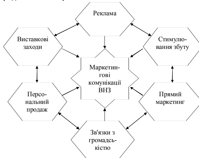
Рис. 1. Склад маркетингових комунікацій ВНЗ

Як бачимо, поняття «маркетингові комунікації» має відображати особливості функціонування всіх елементів комунікаційних засобів, а саме: рекламу; виставки; персональний продаж; зв'язки з громадськістю; прямий маркетинг; стимулювання збуту. На основі проведеного дослідження систематизований склад маркетингових комунікацій ВНЗ представлено на рис. 1.